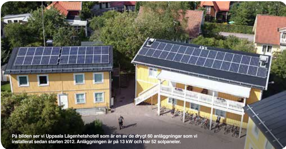
På bilden ser vi Uppsala Lägenhetshotell som är en av de drygt 60 anläggningar som vi installerat sedan starten 2012. Anläggningen är på 13 kW och har 52 solpaneler.

Kontakta kundservice för att komplettera ditt elavtal med ett miljöval på telefon 018-67 84 00 alternativt via mail till: kundservice@upplandsenergi.se