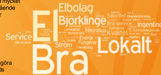
Bild här intill är tagen från SKI utvärderingen om Upplands Energi. Bilden är framtagen av SKI för att på ett översiktligt och enkelt sätt åskådliggöra vad ni kunder förknippar med Upplands

Energi. Frågan som ligger till grund för bilden är: Om vi säger Upplands Energi, vad tänker du på då? Ju fler kunder som sa samma ord ju större typsnitt får ordet i bilden, dvs. en enkel sammanställning av vad ni kunder förknippar med och tycker om Upplands Energi!